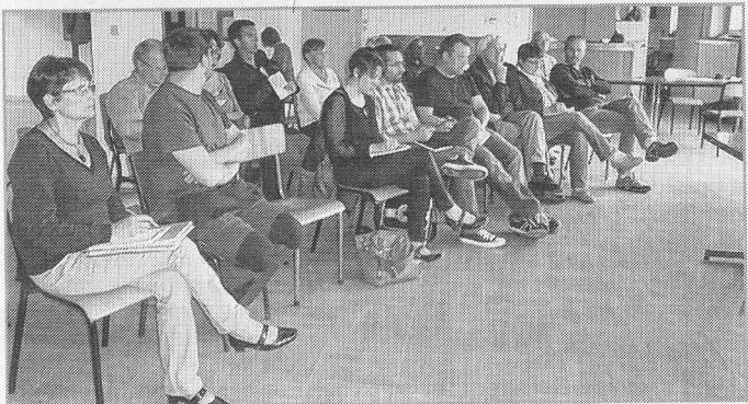
Une trentaine de personnes ont assisté à l'assemblée générale du comité de jumelage coopération La Bresse-Ménaka.

Après la présentation de vidéos et photos récentes de Ménaka, la soirée s'est terminée par un verre de l'amitié.