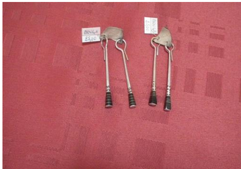
B.oreilles argent/ébène 25€