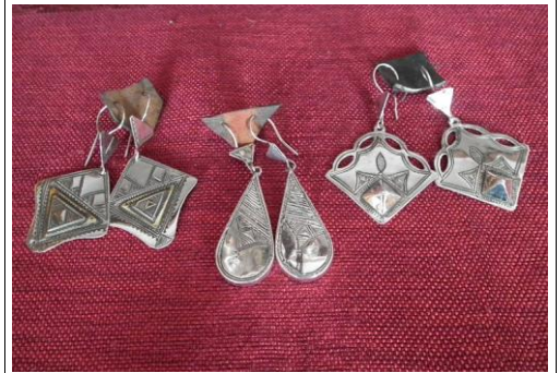
Argent ciselé 28€