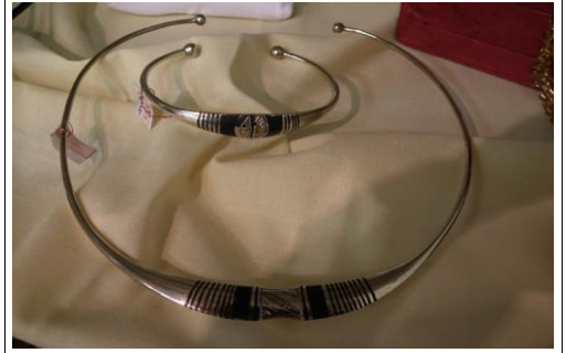
Ens. tour de cou/bracelet 46€