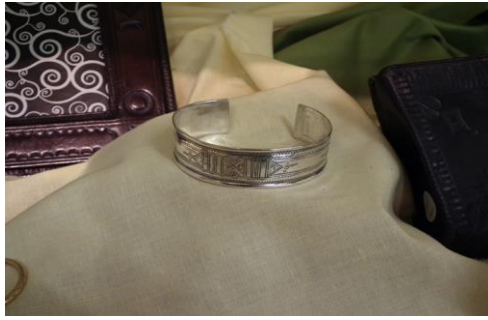
Argent ciselé 50€