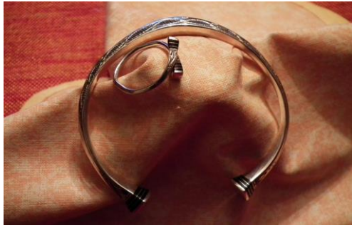
Ensemble Bracelet/bague 78€