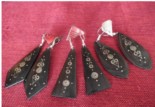
Ebène avec incrustation 18€