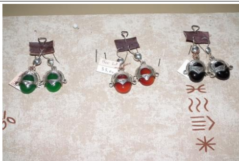
Argent/pierre agathe-onyx 33€