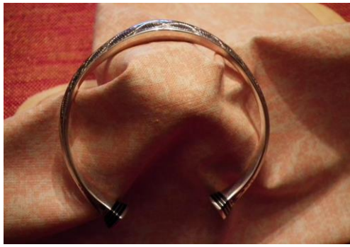
Argent ciselé 55€