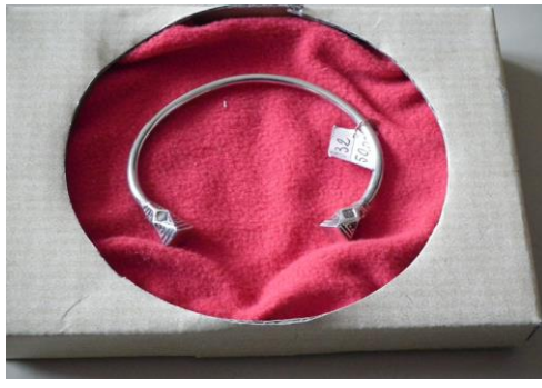
Argent modèle touareg 50€