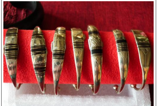
Alliage avec incrustation 20€