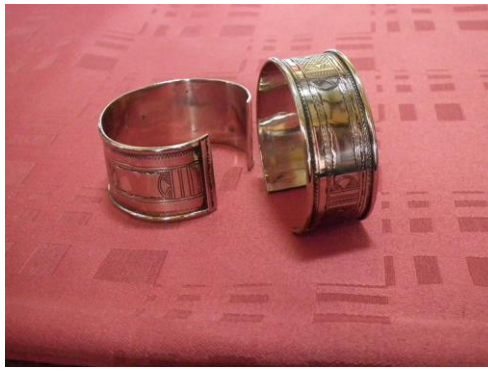
Bracelet large argent/allia. 28€