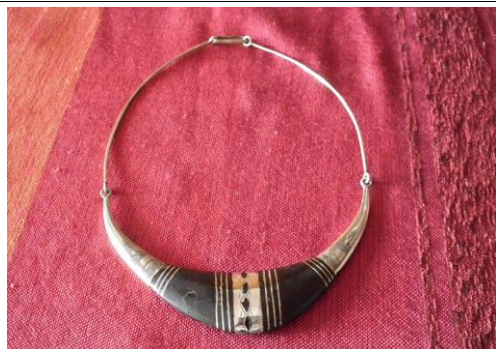
Tour de cou alliage/ébène 35€