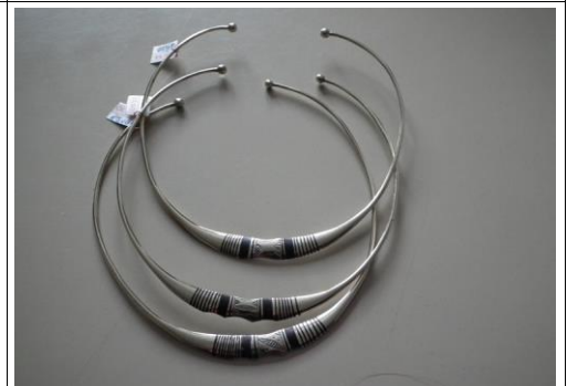
Alliage argent 30€