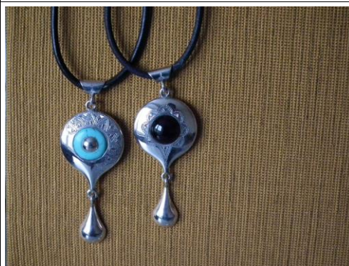
Argent/ turquoise ou onyx 60€