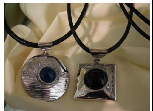
Argent/onyx 48€ - 60€