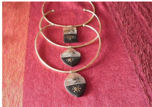
Tour d. cou ouv./médailon 25€