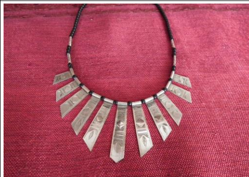
Argent sur collier perle 45€