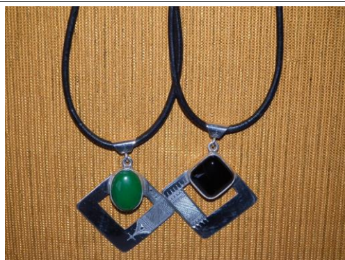
Argent/agathe ou onyx 55€