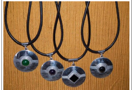
Argent/onyx ou agathe 48€