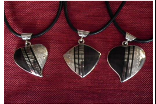
Ebène/argent coeur 55€