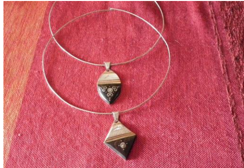
Tour de cou/médailon allia. 20€